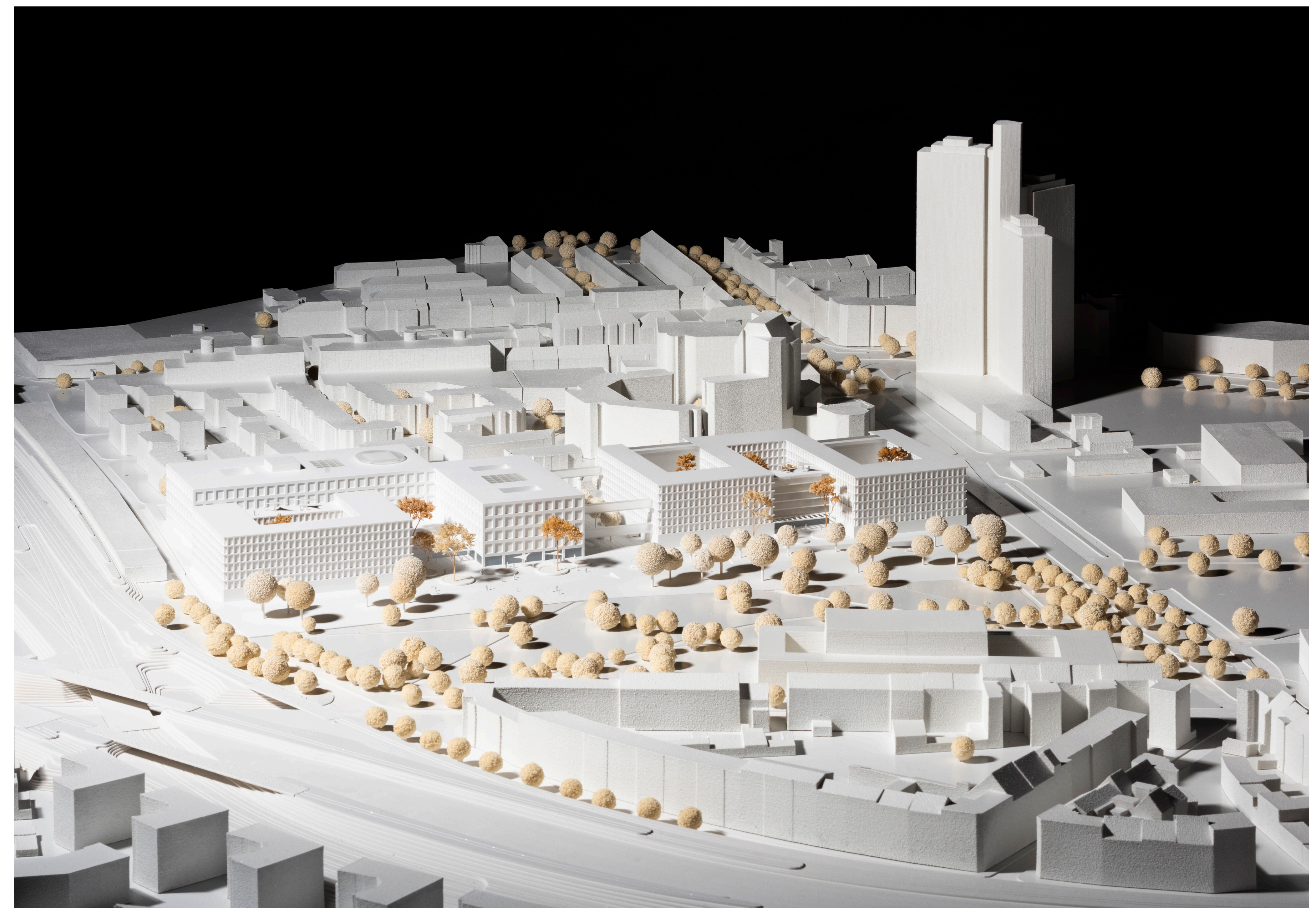
Modellfoto - Blick von Nordosten auf das Justizzentrum