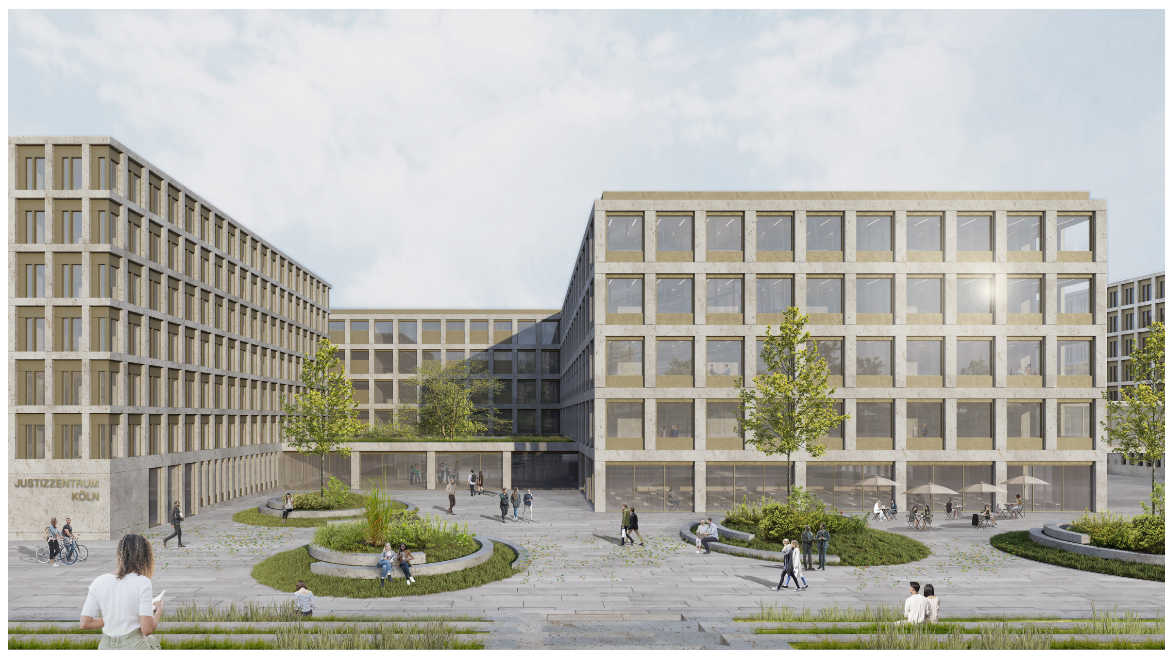
Außenperspektive - Blick vom Inneren Grüngürtel