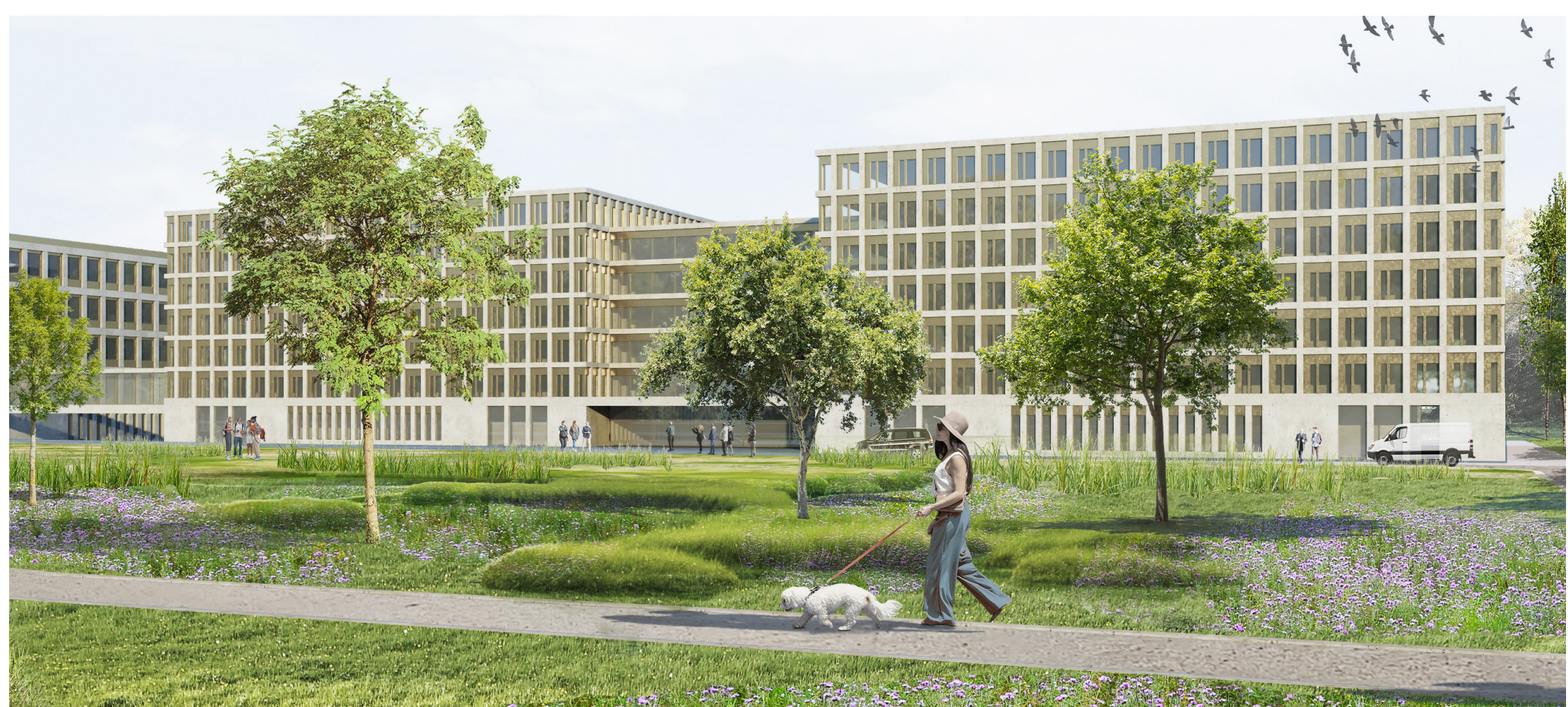
Außenperspektive - Blick von der Luxemburger Straße